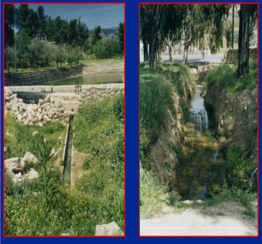
Plate (Photo) 1. A Photo of Qantara Spring Watershed